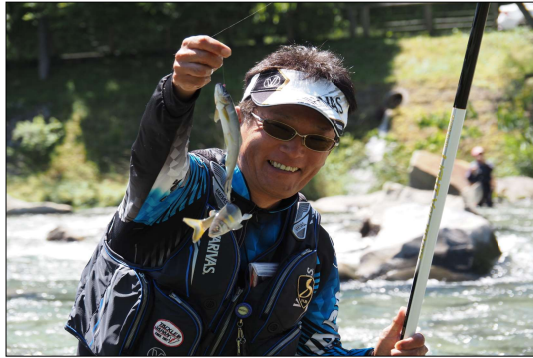
鮎を釣り上げて笑顔を見せる太公望

6月14日(日)和良川鮎釣り的一般解禁を迎えました。取材に伺うと、少しでも安心してできるようにと和良川漁業協同組合や各おとりの屋さんで感染拡大防止の為に対策が取られていました。