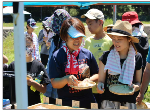
いそばんを買う参加者

例年は、田植え体験後に「田舎料理体験教室」を行い「朴葉ずし」を作ったりしてありますが、閉鎖空間を避けて開催したため、今年は屋外で「朴葉ずし」のお弁当を食べました。昼食前には「いそばん」の販売もあり、お弁当の前にさっそくパンにかぶりつく人もありました。