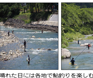
晴れた日には各地で鮎釣りを楽しむ姿が多く見られる。

トが設置されており、誰もが安心して訪れていたように整備されていました。また「和良鮎を守る会」ではドライブスルー方式が導入されており、こちらへも安心して立ち寄っていただけると共に、和良鮎をお取り扱っていたお店の方にも安心していただけると思います。