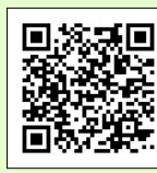
いそばんホームページ