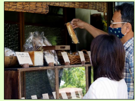
じっくりとパンを選ぶお客さん