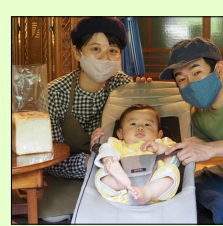
2周年を迎えたいそばん