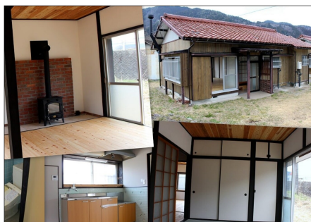
(わらおこし住宅の外観、内観)