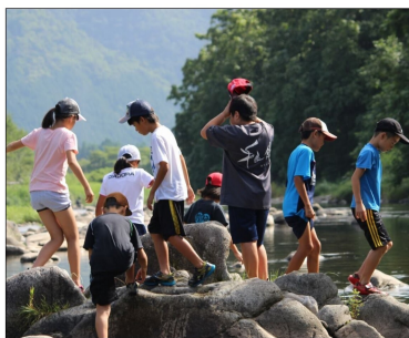
(和良川で遊ぶ子供たち)

地域づくりのひとつは「仲間づくり」だと思います。集落には、自治会長さんをはじめ、必ずキーパーソンとなる人がいます。集落のまとめ役だったり、気軽に相談に乗ってくれる人だったりします。そんな人たちからの支援の取り付けは大きな財産となります。皆が集落で一緒に暮らしていく仲間として活動できるように努めています。わか