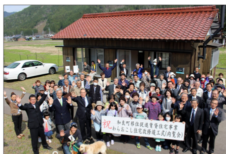
(わらおこし住宅改修竣工の様子)

らないことがあったら、まずはご家族やご近所さん、お友達にも頼ってください。田舎暮らしのだいご味は「人づきあい」であって、ちょっと気をつかうのも「人づきあい」かもわかりません。