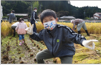
(思わずポーズをとる参加者)