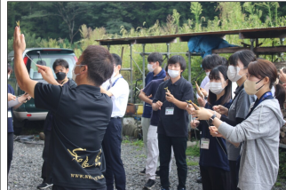
(串打ち体験の様子)