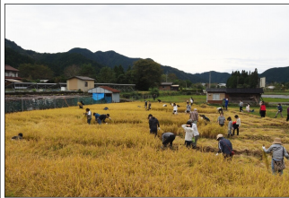
(稲を刈り進める様子)

朝早くから集まったオーナーさん家族は、お天気を気にして空を見上げつつも、楽しそうな笑顔いっぱいいで体験田んぼに集まってくれました。今年は過去最高数の参加者ということもあって、良い感じで横一列に並びます。過去にも参加された方は小気味よくザクザクと刈り進める一方で、初めて体験される方は戸惑う様子も見られました。稲は速いスピードで刈られていくのですが、ぬかるんだところは苦労していました。稲刈りも終盤になるとハサ掛けが始まります。そして、掛け終わったハサの前でお約束の記念撮影です。撮影を始めたころから雨がポツポツと降り始めてきました。