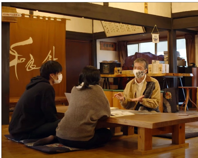
(わらおこしで移住相談を受けている様子)

いいあんばいの田舎で暮らそう 和良町におけるこれまでの移住促進、定住支援の 実績についてご紹介します。